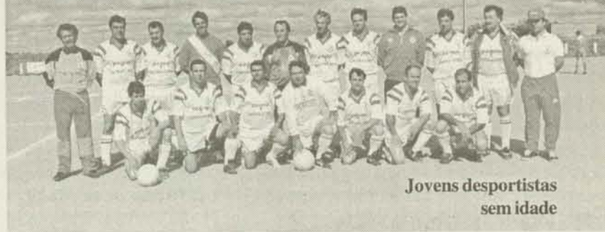
Jovens desportistas sem idade

As “Velhas Guardas” do Sport Nisa e Benfica continuam a actividade desportiva de manutenção, realizando com alguma regularidade jogos de futebol com formações congéneres.