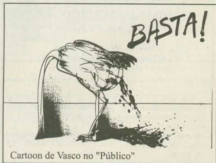
Cartoon de Vasco no "Público"