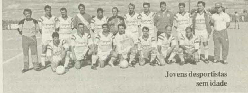
Jovens desportistas sem idade

As “Velhas Guardas” do Sport Nisa e Benfica continuam a actividade desportiva de manutenção, realizando com alguma regularidade jogos de futebol com formações congéneres.