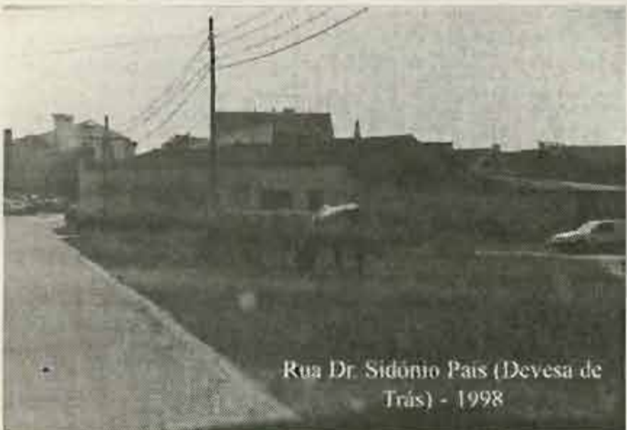
Rua Dr. Sidónio Pais (Devesa de Trás) - 1998

deliberação camarária para a melhoria da Rua Dr. Sidónio Pais , vulgarmente conhecida por Devesa de Trás ? No Deve ou no Haver ? A Câmara deliberou a melhoria, mas não se cumpre. O que andaram os vereadores lá a fazer, se deliberaram e não se cumpriram nem cumprir? Na rua há de tudo, automóveis velhos e novos, tractores, pneus, baterias, escapes, ferros, manilhas, tijolos, ervas, lama, cardos, lixo, pó, óleos e até já pastam ovelhas e animais de cabresto; seria mal empregado não aproveitar a crava! Já lhe chamaram Rainha , porém da Sucata . Lembram-se que ali há indivíduos que têm os mesmos deveres dos outros, mas esquecem-se que ali