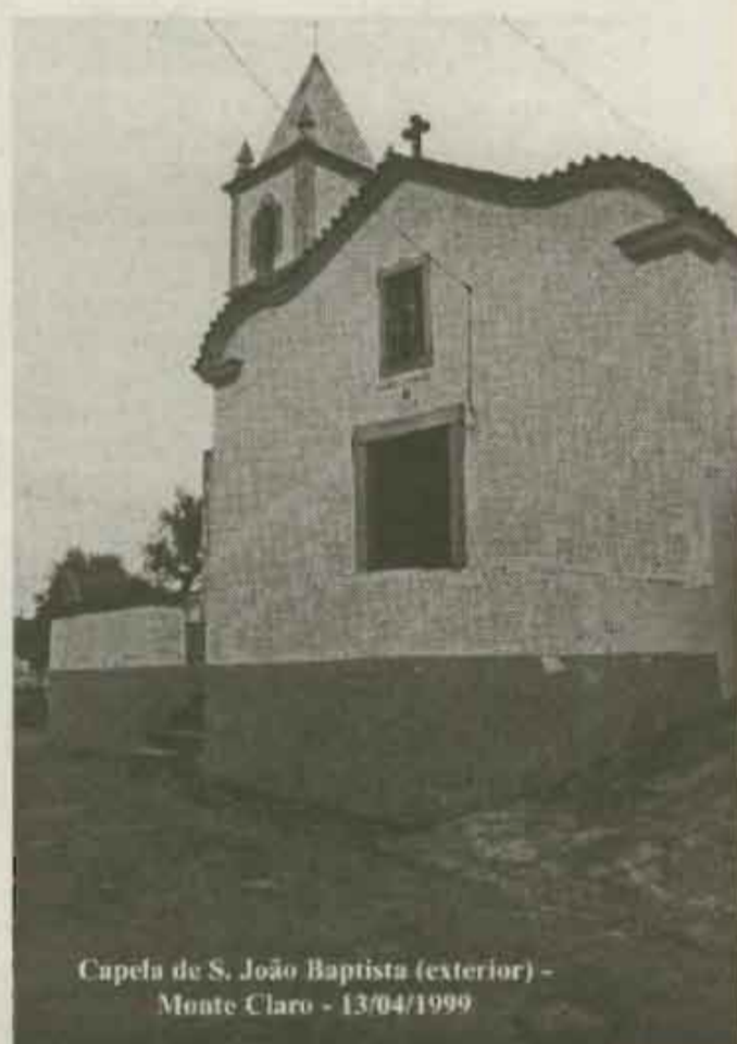
Capela de S. João Baptista (exterior) - Monte Claro - 13/04/1999

Não pensamos recolher documentos e informações, e só depois de escrito e concluído o texto final dar a conhecê-lo. Seria mais fácil assim, porém iremos escrever, publicar e divulgar a história