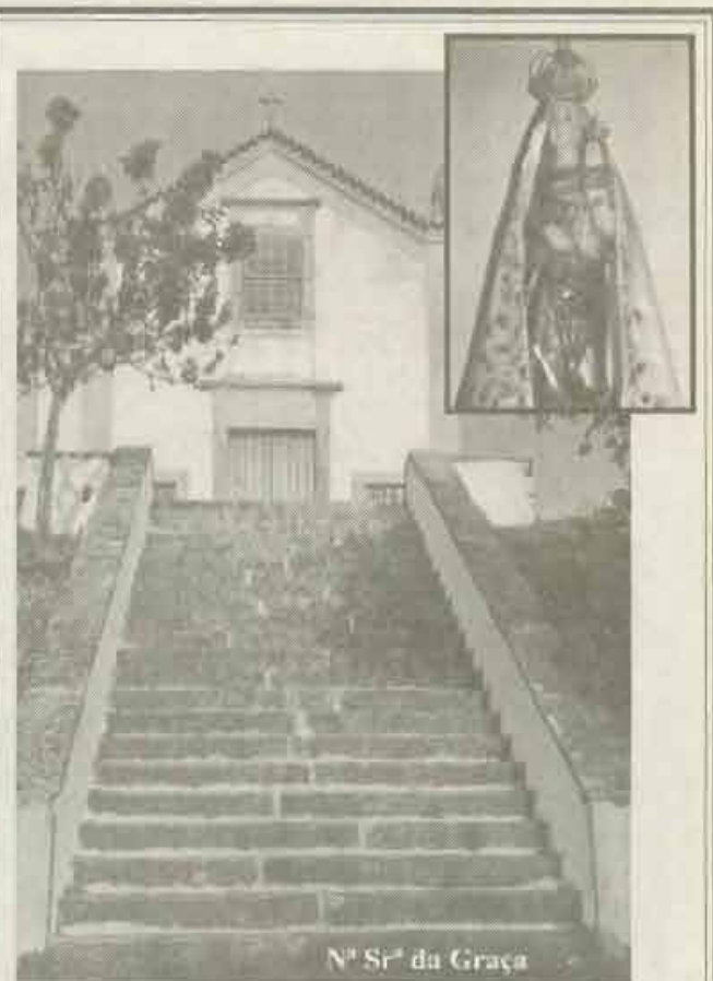
É Primavera, dia de Nossa Senhor da Graça

A concluir, o comunicado das Testemunhas de Jeová informa que a revista estará disponível em mais de 80 idiomas e "far-se-á um esforço especial para distribuir os artigos a entidades e instituições que trabalham junto das crianças".