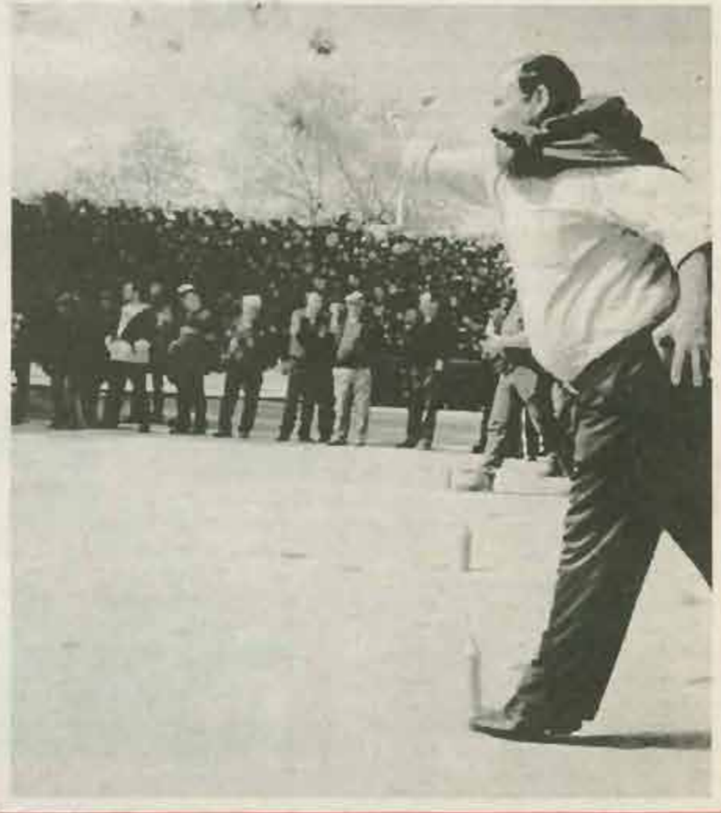
CORREIO DA EUROPA