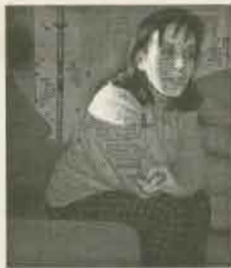
Continuação da pág. anterior

criativo da própria população, para que ela possa participar e envolver-se no seu próprio desenvolvimento.