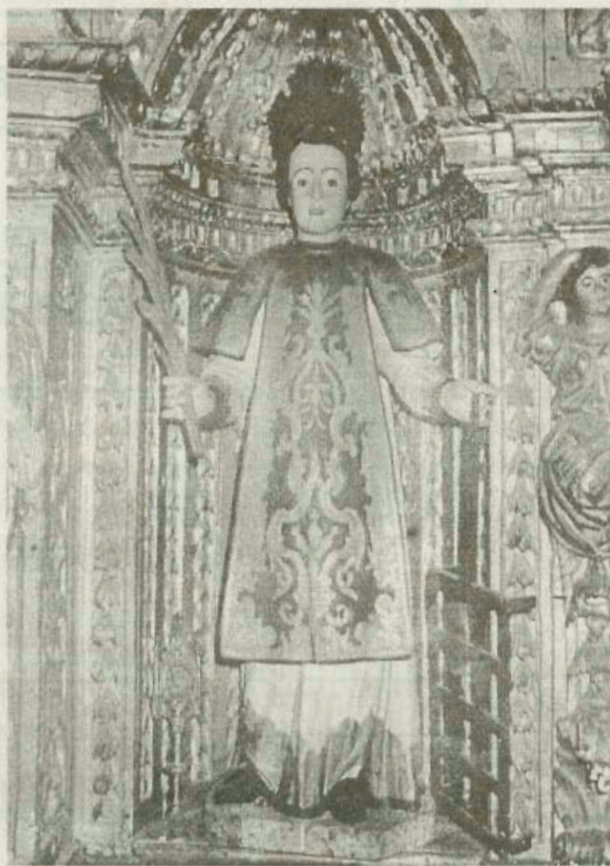
21h30 Concerto Orquestra Ligeira de Nisa

seleccionei, o Jardim do Hospital. Jardim pequeno. Traço comum com o Municipal de Nisa - o projectista foi o mesmo: o paisagista da Cidade Invicta - Jacintho de Mattos.