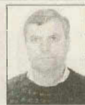
Por António Conicha