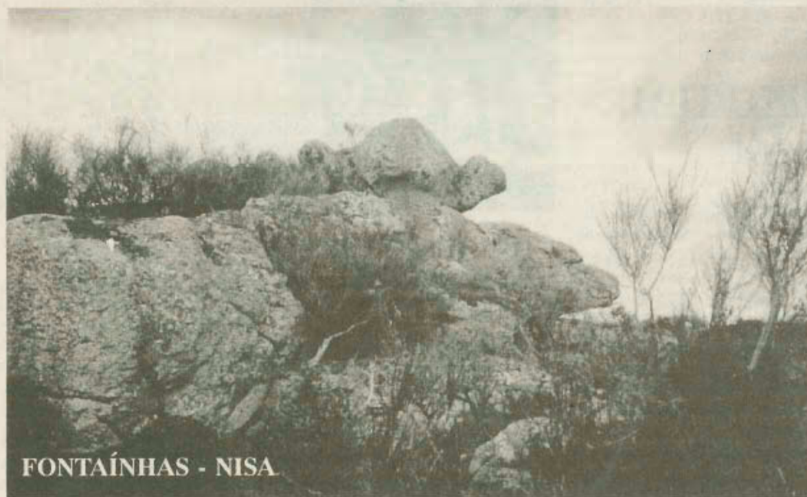
FONTAÍNHAS - NISA