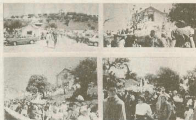
Romaria de N.ª Sr.ª da Graça - 20 de Abril de 1992