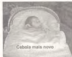
Cebola mais novo

fazem tendo em conta o número de participantes e quando estes acabam por primar pela ausência, são os que comparecem que acabam por pagar um pouco mais, sem necessidade se, a tempo e horas, quem não pôde ir, tivesse o bom senso de avisar.