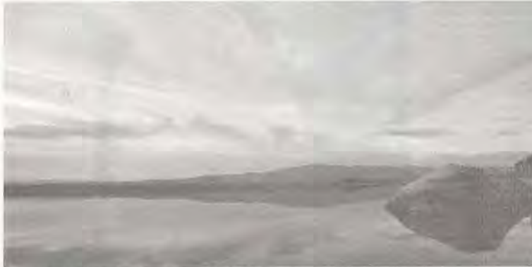
O território da Naturtejo vai estar animado ao longo destes dias

Na Naturtejo, que congrega os municípios de Castelo Branco, Idanha-a-Nova, Nisa, Oleiros, Proença-a-Nova e Vila Velha de Ródão,