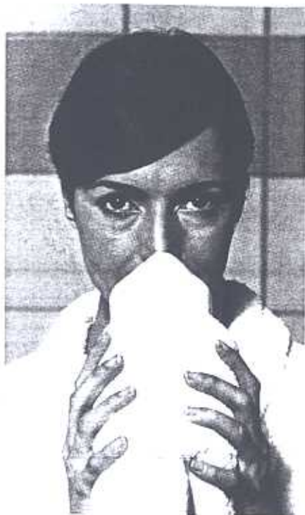
Termas de São Pedro do Sul