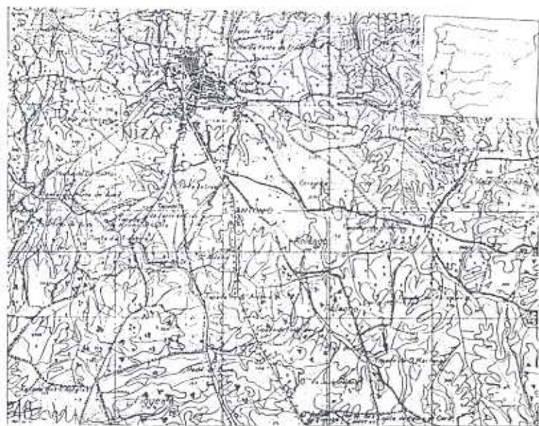
Fig. 1 — Localização da Tapada de D. Mariana segundo a Carta Militar de Portugal, folha 324 (NIZA), esc.: 1:25.000 (Red.).

Apesar de distanciada no tempo, e sem a devida confirmação arqueológica, parece-nos ser a notícia de particular interesse, por um lado, porque constitui informação importante para a localização de mais uma necrópole romana no Nordeste Alentejano, por outro, porque procede à primeira descrição do teor do espólio exumado, o qual se integra na tipologia recentemente estabelecida para este tipo de materiais, recolhidos igualmente em necrópoles do Alto Alentejo (4).