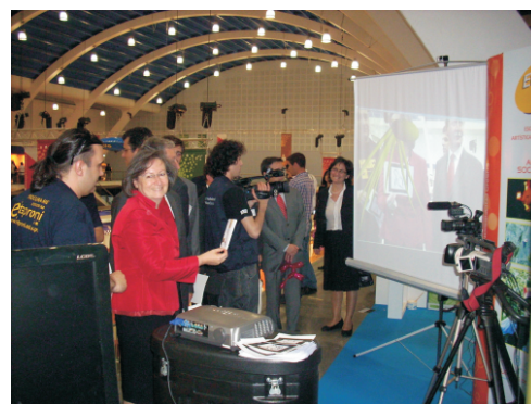
Ministra da Educação visita Stand da Etaproni no Forum

No stand da Etaproni foi possível realizar interacções de carácter diverso com produtos multimédia desenvolvidos pelo Curso Técnico de Multimédia, com destaque para um aplicativo de realidade aumentada, que permite a adição e interacção de elementos tridimensionais ao mundo real.