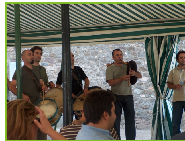
Aqui há Baile 3,4 e 5 de Setembro de 2004