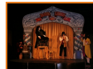
Semana Cultural de Amieira do Tejo 3 a 9 de Setembro de 2004