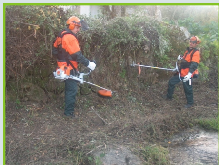
Limpeza de linhas de água por Sapadores Florestais