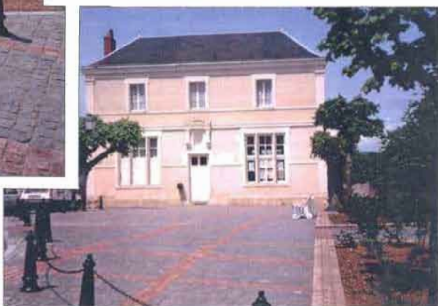
Place Alexander CALDER