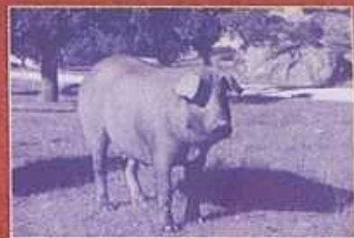
CEDILLO - MONTALVÃO ( NISA ) PERAIS - VILA VELHA DE RODÃO