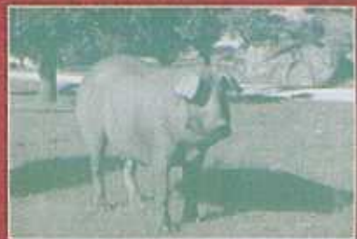
CEDILLO - MONTALVÃO ( NISA ) PERAIS - VILA VELHA DE RODÃO