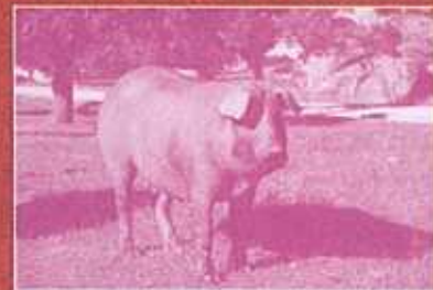
CEDILLO - MONTALVÃO ( NISA ) PERAIS - VILA VELHA DE RODÃO