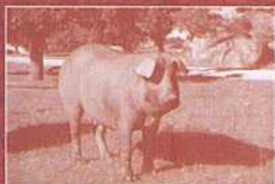
CEDILLO - MONTALVÃO ( NISA ) PERAIS - VILA VELHA DE RODÃO