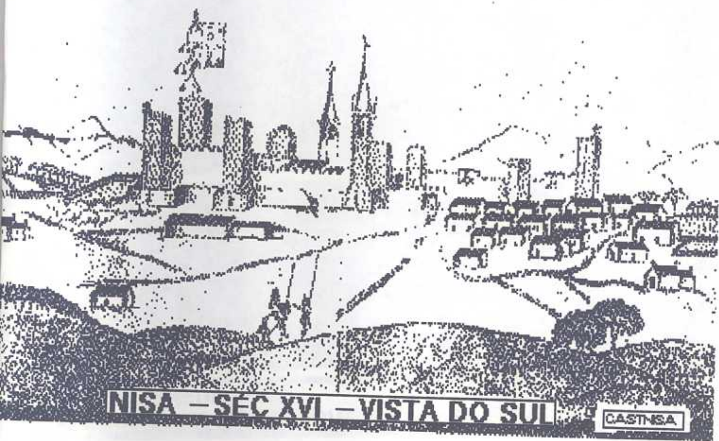
NISA – SÉC XVI – VISTA DO SUL