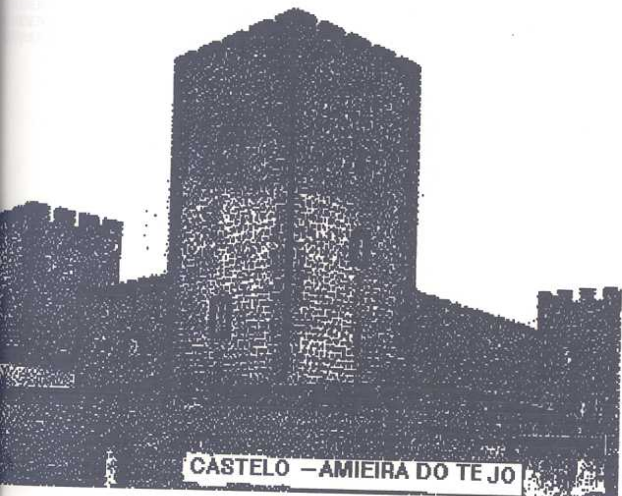
CASTELO - AMIEIRA DO TEJO